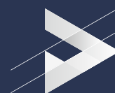
Zdjęcie_01_Przykłdowa wizualizacja jednej płyty_2600 mm x 1200 mm